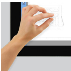
Écran tactile Écran tactile full HD 22 pouces