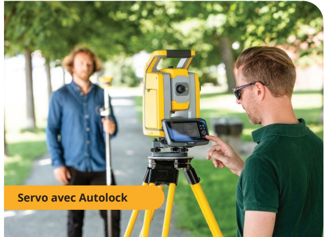
Servo avec Autolock