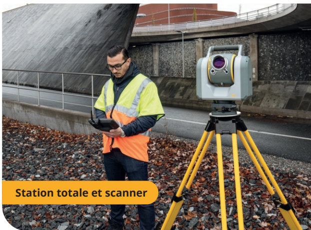
Station totale et scanner